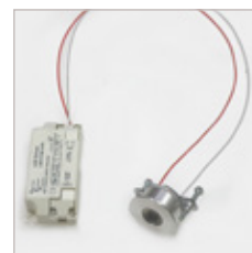
TRIO MR11 INVIOLENT AVEC CONVERTISSEUR