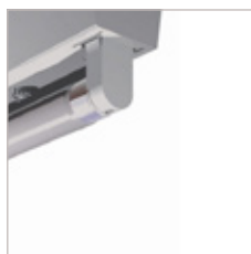
TUBE T8 SANS VASQUE 1 OU 2 TUBES