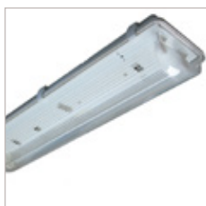
TUBE T8 AVEC VASQUE 1 OU 2 TUBES