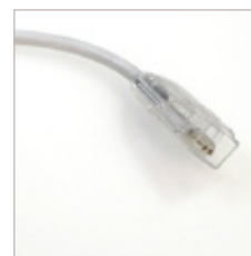
CONNECTEUR IP54 BARRE LINE 200 MM