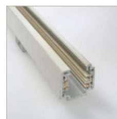
RAIL POUR ECLAIRAGE EN TRACKLIGHT