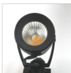
PROJECTEUR D'ACCENTUATION "TRACKLIGHT" 10W