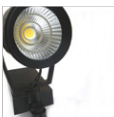
PROJECTEUR D'ACCENTUATION "TRACKLIGHT" 42W