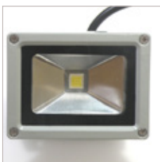
FLOOD LIGHT COB 10 W