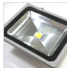
FLOOD LIGHT COB 80 W