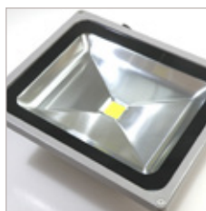
FLOOD LIGHT COB 50 W