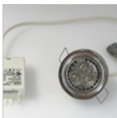
TRIO MR11 AVEC CONVERTISSEUR