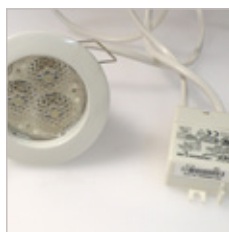
TRIO MR16 AVEC CONVERTISSEUR