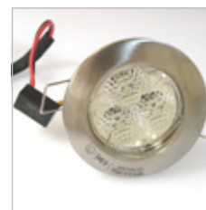
KIT SPOTLED TRIO 24V AVEC CONNECTEUR 6 POLES