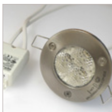
TRIO INVIOLEBLE AVEC CONVERTISSEUR