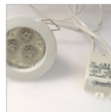
TRIO MR16 AVEC CONVERTISSEUR