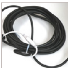
KIT D'ECLAIRAGE GAINE LED FLEX 15W/M - ONE CLICK