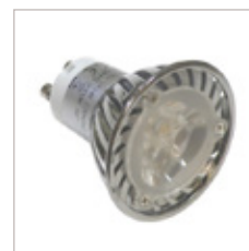
AMPOULE MR16 LEDS 3X1W GU10 220V