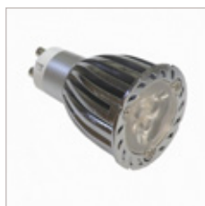
AMPOULE MR16 LEDS 3X2W GU10 220V