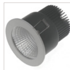
ENCASTRE DE PLAFOND 15 W D'INTERIEUR ENTIO