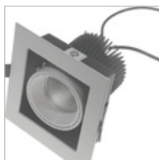
ENCASTRE DE PLAFOND 15 W D'INTERIEUR APLO