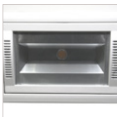
ENCASTRE DE PLAFOND 30 W D'INTERIEUR AFINO