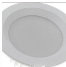
ENCASTRE DE PLAFOND 12 W D'INTERIEUR PELEO