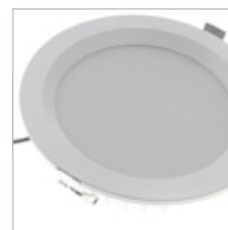
ENCASTRE DE PLAFOND 30 W D'INTERIEUR PELEO