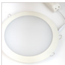
DOWNLIGHT PLAT 30W