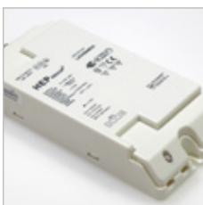
CONVERTISSEURS HEP LHV 60W 24V