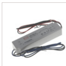
CONVERTISSEURS MEANWELL LPV 12/24V 60W