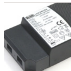
CONVERTISSEURS LGDD 12/24V 30W