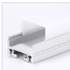
PROFILE ALUMINIUM AT-5, OPTIQUE, EMBOUT, CLIPS