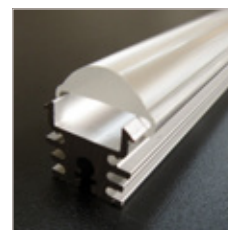
PROFILE ALUMINIUM Z22, OPTIQUE, EMBOUT, CLIPS