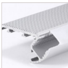
PROFILE ALUMINIUM STAIR-1, OPTIQUE, EMBOUT, CLIPS