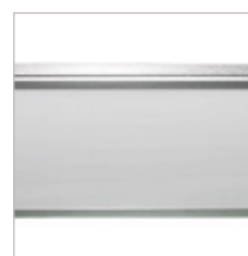
DALLE LUMINEUSE DIMMABLE SOLENA 595 X 1195 50 W