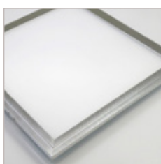
DALLE LUMINEUSE DIMMABLE SOLENA 595 X 595 26 W