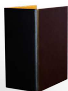
18 Noir - doré Goud - zwart