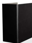
17 Noir - argent Zilver - zwart