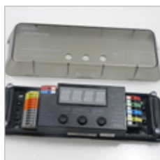
CONTROLEUR LINEAIRE 720D