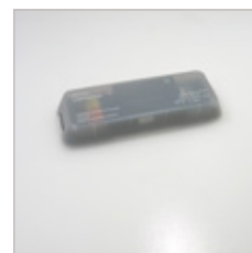
CONTROLEUR LED DIMMABLE LINEAIRE