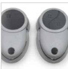
EMETTEUR PORTATIF SANS FIL 1 A 4 BOUTONS