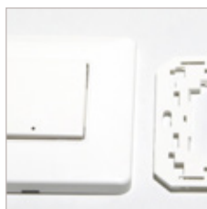
EMETTEUR INTERRUPTEUR SANS FIL 1 A 2 BOUTONS