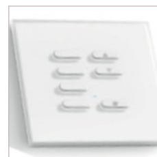
INTERRUPTEUR SANS FIL 1 A 7 BOUTONS