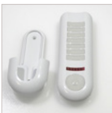
TELECOMMANDE TELECO 7 BOUTONS