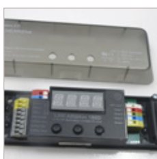
CONTROLEUR LINEAIRE 180D