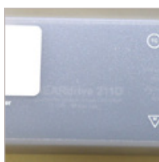
CONTROLEUR LE DIMMABLE LINEAIRE