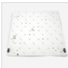
MOTEUR D'ECLAIRAGE CARRE