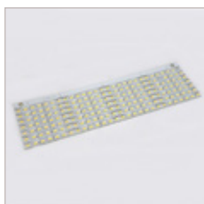
MOTEUR D'ECLAIRAGE CARRE/BARRETTE