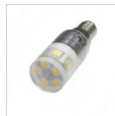
AMPOULE 3W E14