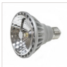
AMPOULE PAR30 220 V E27