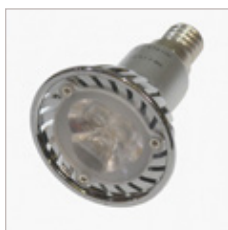
AMPOULE MR16 3X1 W E14 220 V