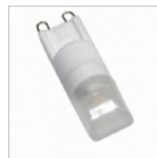
AMPOULE 2W G9