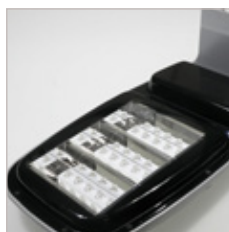
TETE DE MAT 30 W