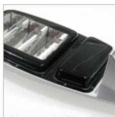
TETE DE MAT 60 W ET 90 W