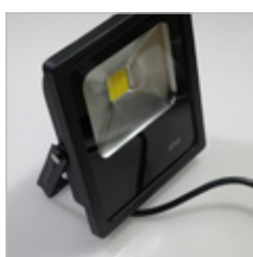
PROJECTEUR NOIR METAL 30 W