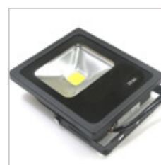
PROJECTEUR NOIR METAL 50 W