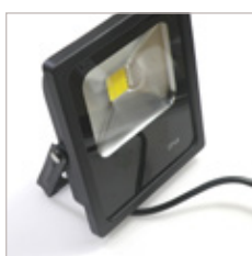
PROJECTEUR NOIR METAL 10 W