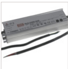
CONVERTISSEURS MEANWELL HLG 12/24V 240W