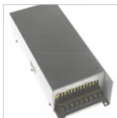
CONVERTISSEURS S-400 12/24V