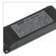
CONVERTISSEURS LE15 700 mA 15 W