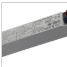
CONVERTISSEURS LED DRIVER LT 48V 20 W