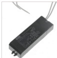
CONVERTISSEURS TE12 HALOGENE GRADABLE 12V