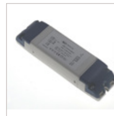
CONVERTISSEURS PDV 12V