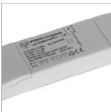
CONVERTISSEURS PTDC 350/700 mA ET 12V