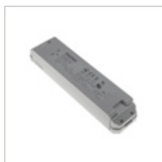
CONVERTISSEURS TRIDONIC LCU 12/24V 100W