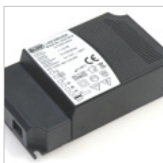
CONVERTISSEURS LGDD 12/24V 30W