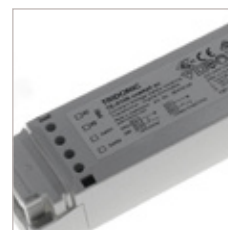
CONVERTISSEURS TRIDONIC TE-0105 DALIX HALOGENE 12V AVEC BOUTON POUSSOIR