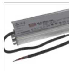
CONVERTISSEURS MEANWELL HLG 12/24V 240W