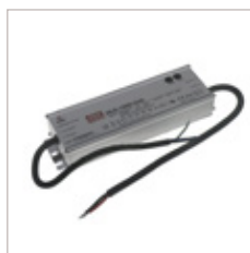
CONVERTISSEURS MEANWELL HLG 12/24V 150W