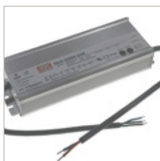
CONVERTISSEURS MEANWELL HLG 12/24/48V 320W