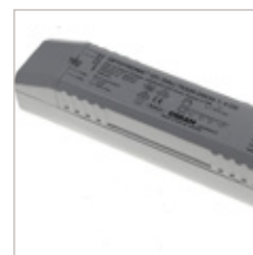
CONVERTISSEURS OSRAM DALI 4 CANAUX 24V 75 W