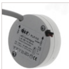
CONVERTISSEURS QLT ROND PLR 350 mA 9 W