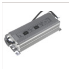
CONVERTISSEURS HV-12060C 12/24V 60 W