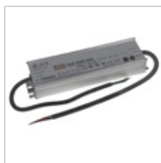
CONVERTISSEURS MEANWELL HLG 12/24V 240W