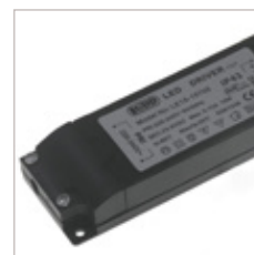
CONVERTISSEURS LE15 700 mA 15 W