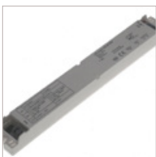
CONVERTISSEURS LT 36V 60 W