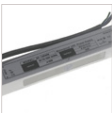
CONVERTISSEURS HV 12/24V 30 W