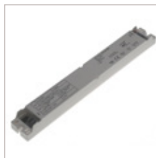
CONVERTISSEURS LT 35V 60 W