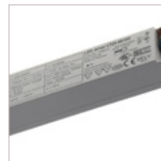
CONVERTISSEURS LED DRIVER LT 48V 20 W