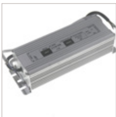
CONVERTISSEURS HV 12/24V 60 W