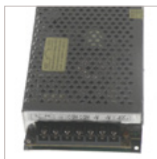
CONVERTISSEURS S-100 GRILLAGEE 12/24V