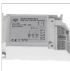
CONTROLEUR DLDC/PTDCCD 1/3 CANAUX ESCLAVE