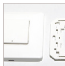
INTERRUPTEUR SANS FIL