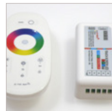
CONTROLEUR ET TELECOMMANDE 4 CANAUX X 6 A