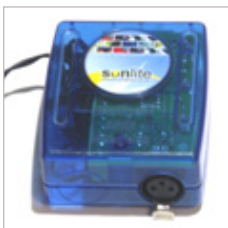
BOITIER DE PROGRAMMATION SUNLITE DMX512