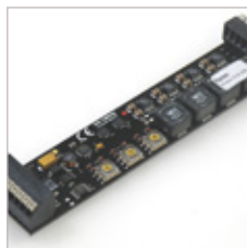
CONTROLEUR RGB 4 CANAUX 350/500/700 mA