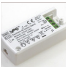
DETECTEUR SENSITIF CELLULE ON/OFF