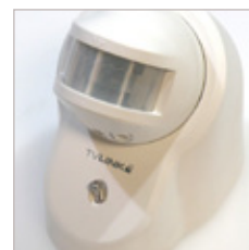
DETECTEUR DE MOUVEMENT RADIO FREQUENCE ON/OFF 3 REGLAGES