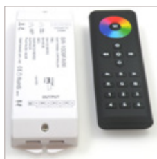
CONTROLEUR ET TELECOMMANDE SR-1009FAWI AVEC WIFI