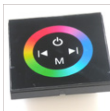
INTERRUPTEUR MURAL TACTILE RGB 12/24V