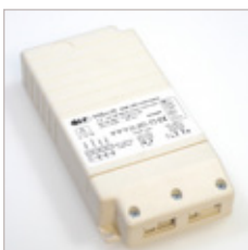
CONTROLEUR QLT RBOX