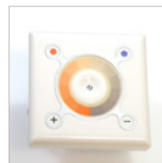
CONTROLEUR TACTILE MURAL