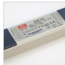
CONTROLEUR MEANWELL DAP-04