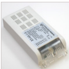
CONTROLEUR PTLDCC/RGB/SL 3 CANAUX