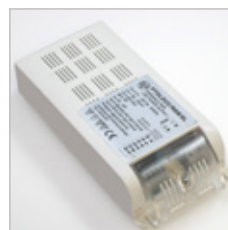
CONTROLEUR PTDLDCC/RGB/SL 3 CANAUX