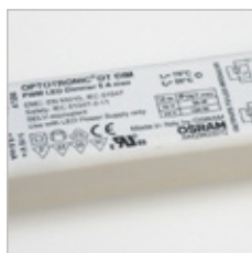
INTERFACE LED 1-10V 120W