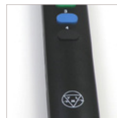
TELECOMMANDE INFRA ROUGE VLM