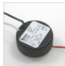
DIMMER UNIVERSEL DEBUT/FIN DE PHASE