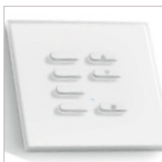
INTERRUPTEUR SANS FIL 7 BOUTONS RGB