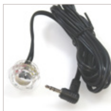
RECEPTEUR INFRA ROUGE JACK POUR TELECOMMANDE VLM/RGB