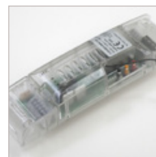
CONTROLEUR 3 CANAUX TVRGBDU868