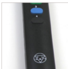
TELECOMMANDE INFRA ROUGE VLM