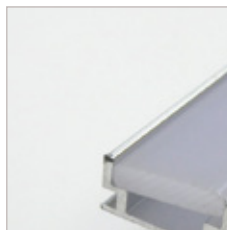
PROFILE ALUMINIUM ALH-11, OPTIQUE, EMBOUT, CLIPS