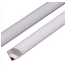
PROFILE ALUMINIUM AC-2, OPTIQUE, EMBOUT, CLIPS