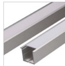
PROFILE ALUMINIUM W31, OPTIQUE, EMBOUT, CLIPS