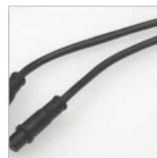
CONNECTEUR MINI-DIN FILS