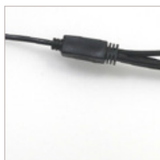
CONNECTEUR MINI-DIN AVEC 4 SORTIE DE JACK