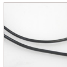
CONNECTEUR MINI-DIN 4 FILS