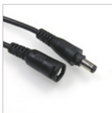
CONNECTEUR MINI-DIN FERMETURE 1/4