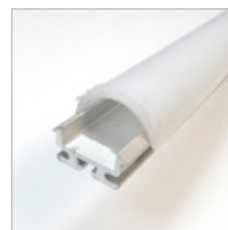
PROFILE ALUMINIUM Z201, OPTIQUE, EMBOUT, CLIPS