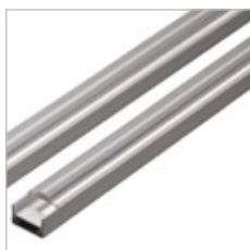
PROFILE ALUMINIUM Z201, OPTIQUE, EMBOUT, CLIPS