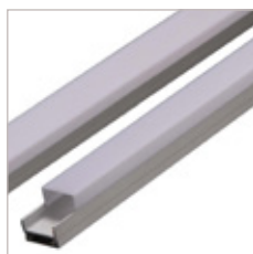
PROFILE ALUMINIUM AT-2, OPTIQUE, EMBOUT, CLIPS