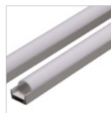
PROFILE ALUMINIUM AT-1, OPTIQUE, EMBOUT, CLIPS